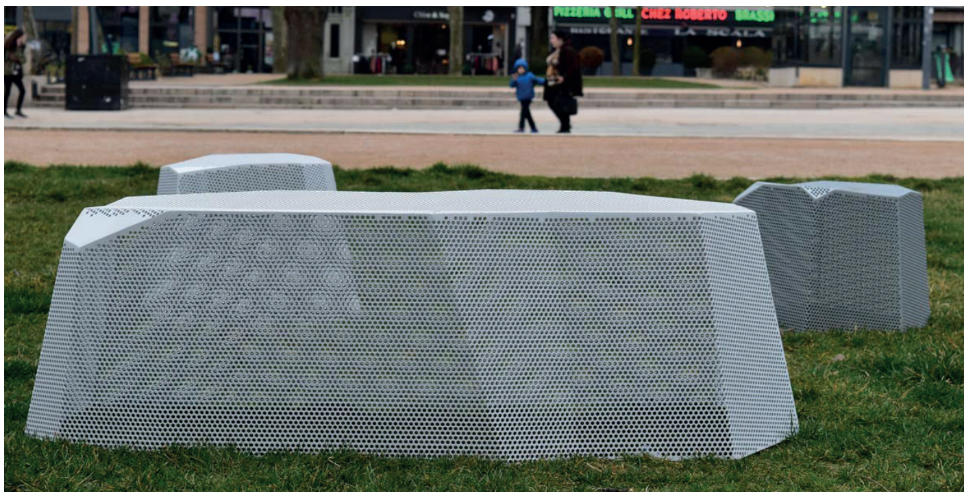
Design : Franck Magné

Assises Rocs. La famille rocs est constituée de 3 éléments à composer librement. Dessiné comme un élément minéral, Rocs établit visuellement un lien avec son environnement. Ses jeux de trames de découpe proposent une vibration visuelle et font de ces rochers échoués des dentelles de métal, légères et contemporaines. Ces assises présentées en version micro perforée peuvent être déclinées en version pleine.