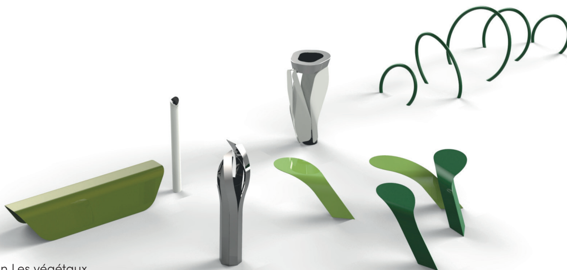
Collection Les végétaux