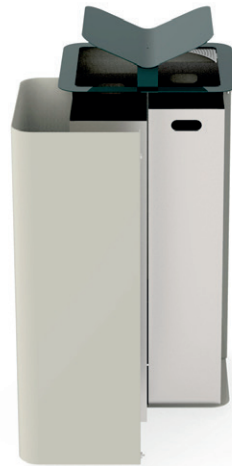
Versions fixation par scellement et fixation murale