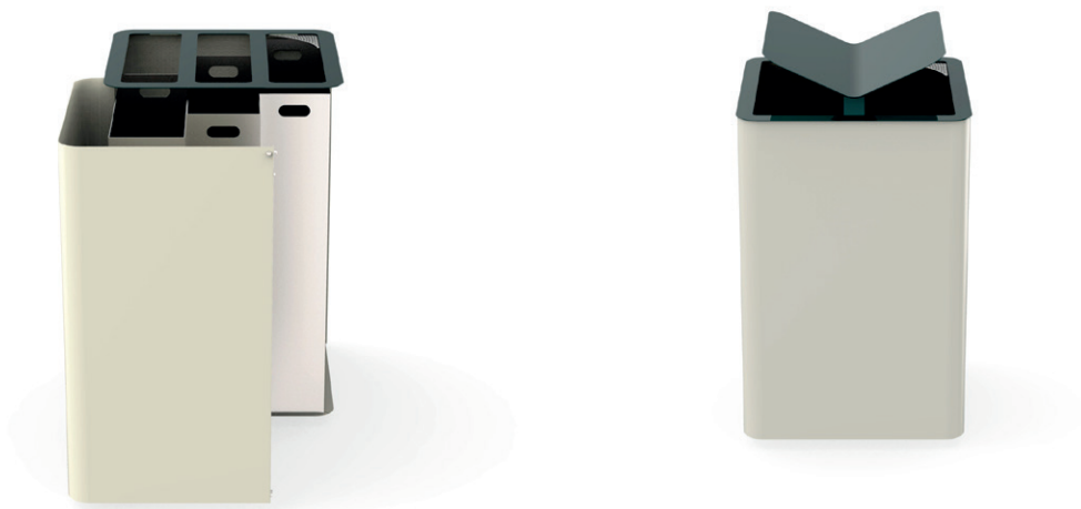
Corbeille 60x60 Cité 3 flux ouverte et Corbeille 60x60 Cité