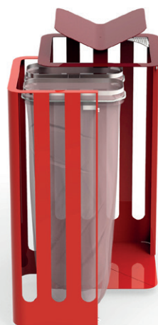
Versions fixation par scellement et fixation murale